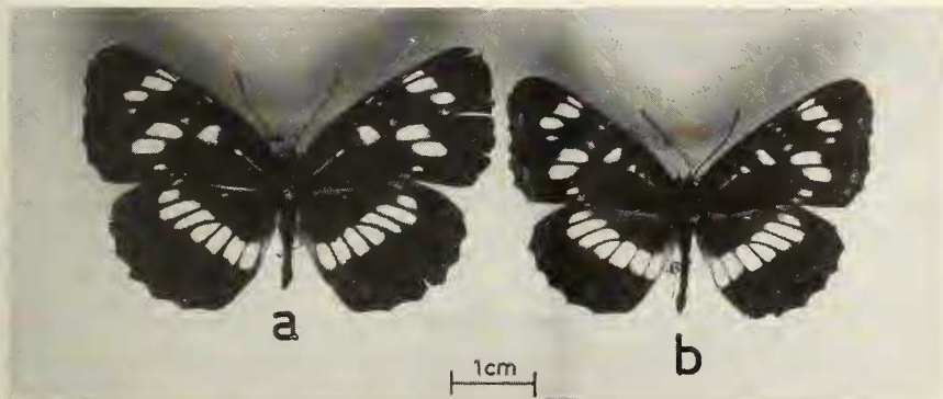
Fig. 1 : Neptis rivularis (SCOPOLI, 1763), Greece, Macedonia, Rhodopi mountains, 1400-1600 m, 27.VII.1987. a. Female, upperside; b. Male, upperside.

The capture of the first specimen revealed that this was in fact Neptis rivularis (SCOPOLI, 1763) (Fig. 1), which to our knowledge has never previously been recorded from Greece. Further search produced a fair series and we found the species to exist in well established colonies within the 1400-1600 m zone.